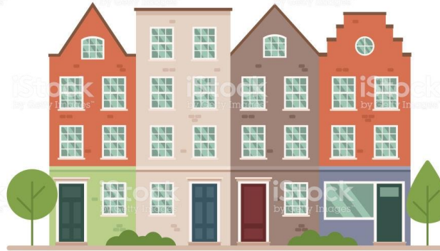
Comunidades de propietarios